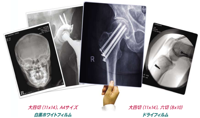
大四切 (11x14), A4サイズ 白黒ホワイトフィルム

マルチメディア・ドライイメージャHorizon GS-s(ホライズン)は、ドライフィルム、白黒ホワイトフィルムの出力を可能にした多機能マルチメディア・ドライイメージャです。Horizon GS-s(ホライズン)は、DICOMやWindowsネットワークプリンティングを含むあらゆる業界標準プロトコルに対応(オプション)、高画質出力、高速プリント、ネットワーク機能、大容量画像データスプールによる高速トータルスループットの実現など先進機能を標準装備しています。