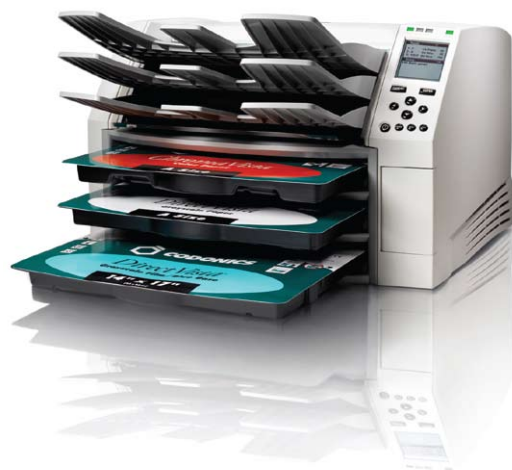
A4サイズ カラーホワイトフィルム