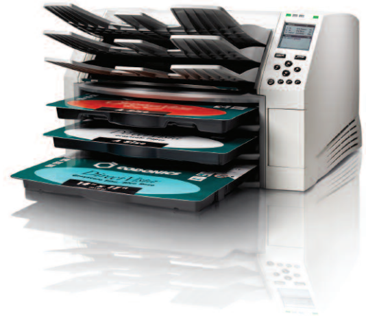
A, A4 Papier Couleur